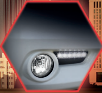
ไฟเคย์ไลท์