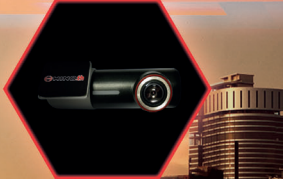
กล้องทวิทัศน์