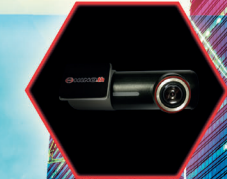
กล้องหน้ารถ