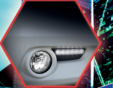
ไฟเทคโนโลยี